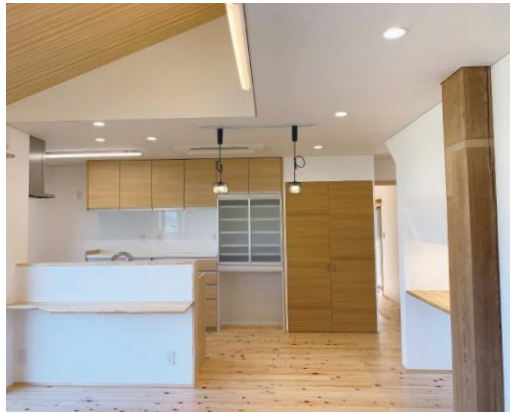
旧母屋より受け継がれたツガの大黒柱。 これから先も末永く家族を見守ってくれる ことでしょう。