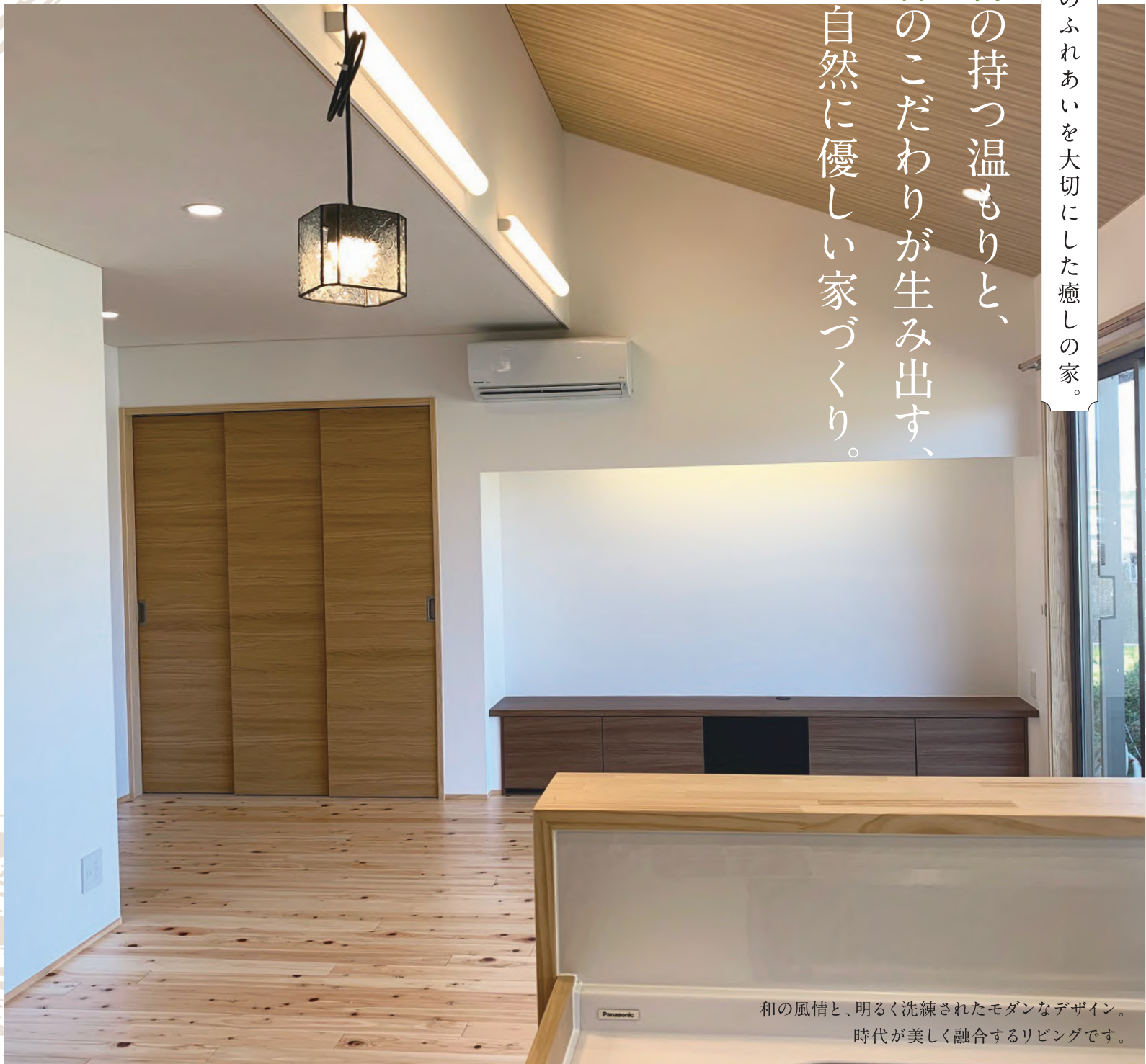
和の風情と、明るく洗練されたモダンなデザイン。 時代が美しく融合するリビングです。

地域の気候や風土に根ざし、 時が経つほどに味わいが増す 美しさと堅牢さを合わせ持つ木の家。 自我 情緒を育み 他人への優しさ 思いやりを育て 家族のふれあいを大切にしたい家づくり。