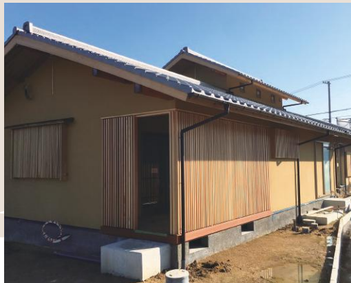
外からの視線を気にすることなく、 干しものが出来る物干デッキ。涼風が通り抜け、 各室を涼しくさせます。